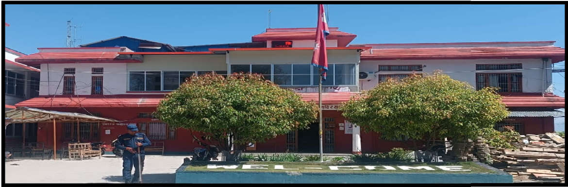
Figure 2 कार्यालय भवन