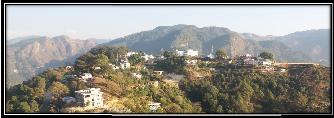
Figure 1 कार्यालयरहेको परिवेस