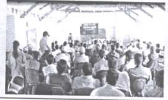
सार्वजनिक सुनुवाईमा सहभागीहरू