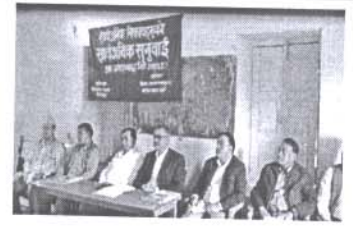
सार्वजनिक सुनुवाईमा उपस्थित विभिन्न अतिथिहरू