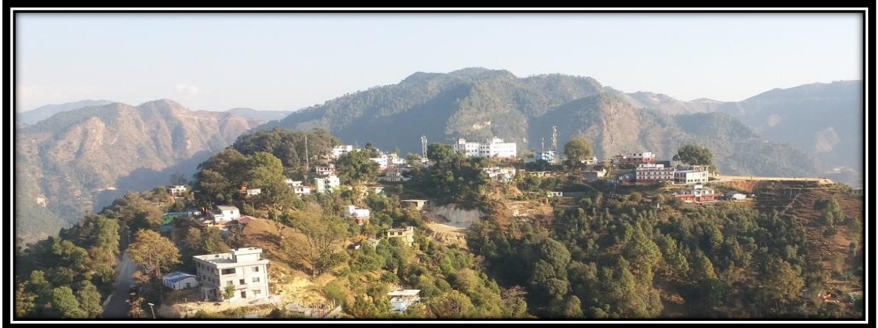
Figure 1 कार्यालय र हेको परिवेस