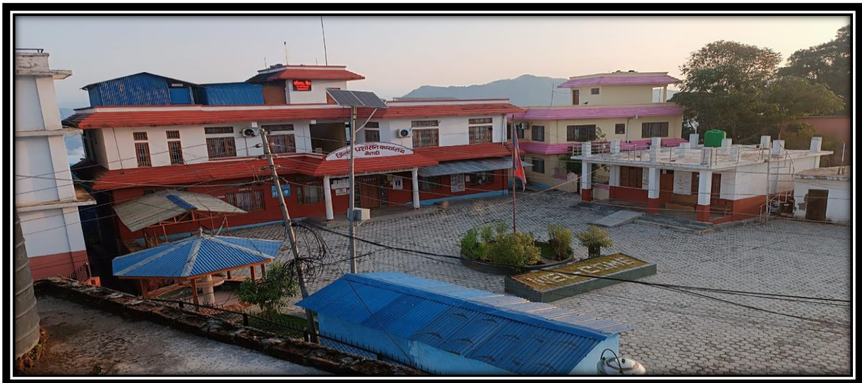
Figure 2 कार्यालय भवन