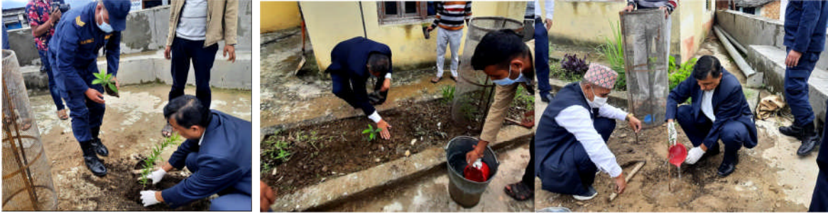
Figure ३ प्र.जि.अ. र प्र.अ. द्वारा पुष्प विरुवा रोपण