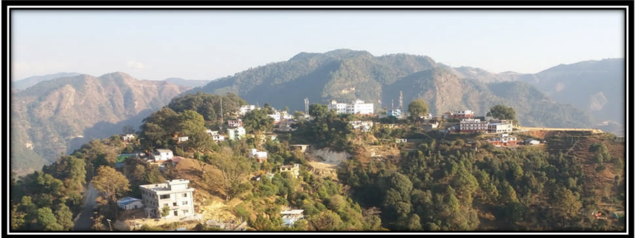
Figure 1 कार्यालय रहेको परिवेस