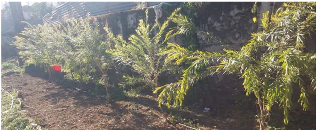
Figure 4 : कार्यालय परिसरका बोट विरुवाहरूको गोडमेत तथा मलजल