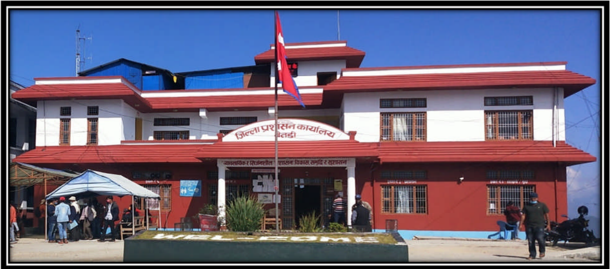
Figure 2 कार्यालय भवन