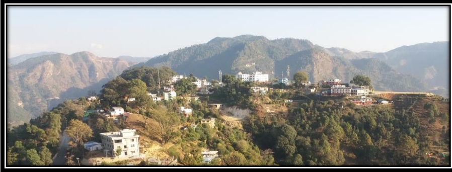
Figure 1 कार्यालय र हेको परिवेश