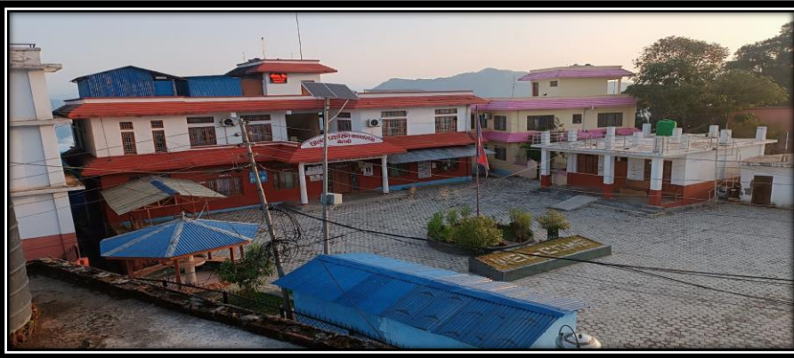
Figure 2 कार्यालय भवन