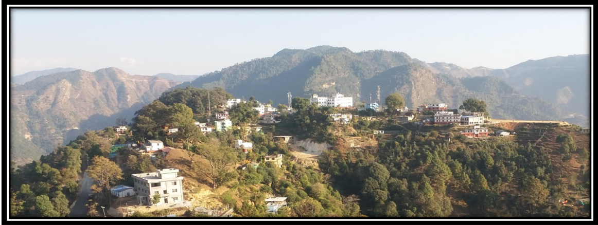
Figure 1 कार्यालय र हेको परिवेस