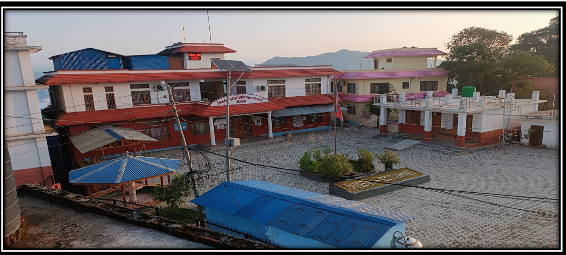
Figure 2 कार्यालय भवन